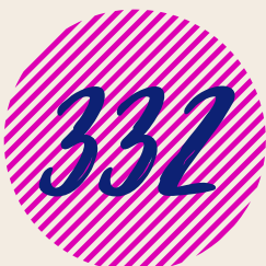
Totaal aantal inclusies