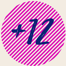
Inclusies in januari